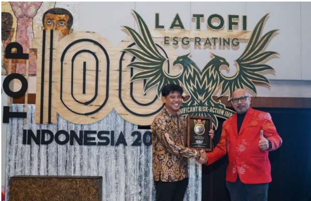
PT Pupuk Kujang