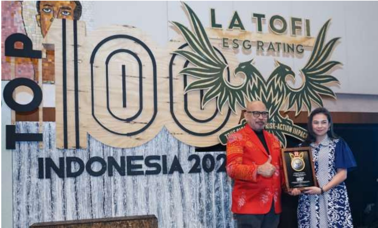
PT MIND ID