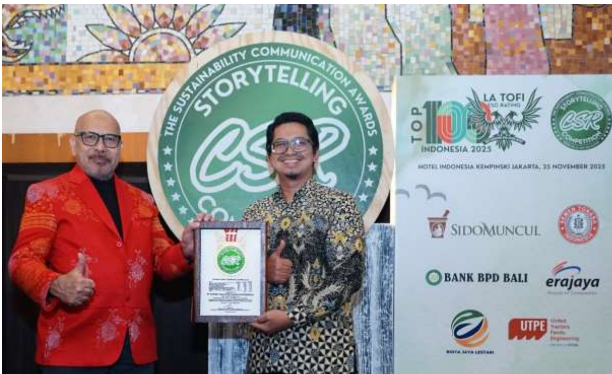
PT United Tractors Pandu Engineering (UTPE)