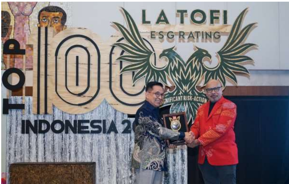
PT Indah Kiat Pulp & Paper