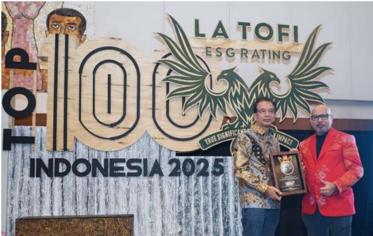
PT Erajaya Swasembada