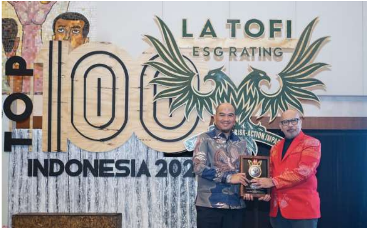
PT Bukit Asam Tbk