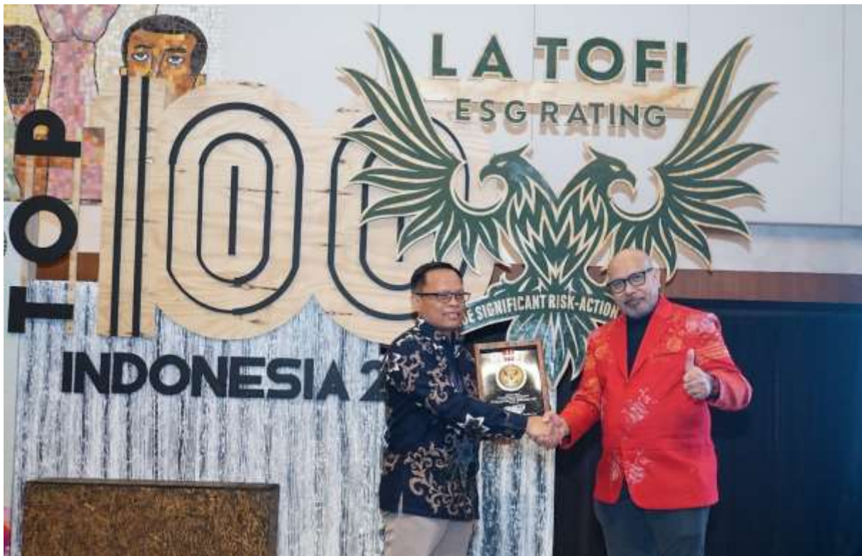
PT Solusi Bangun Indonesia