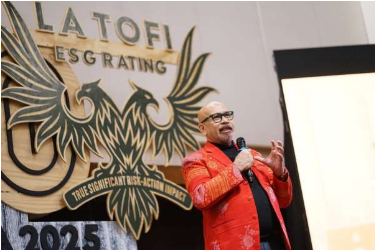
“Corporations as Guardians of the Earth” oleh La Tofi , Principal Assessor La Tofi ESG Rating