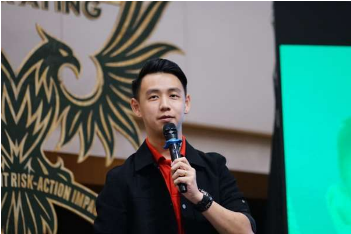
“Preparing Corporate Executives to Become an ESG Doctor – The Portman University Way” oleh Gym Chan , PORTMAN University