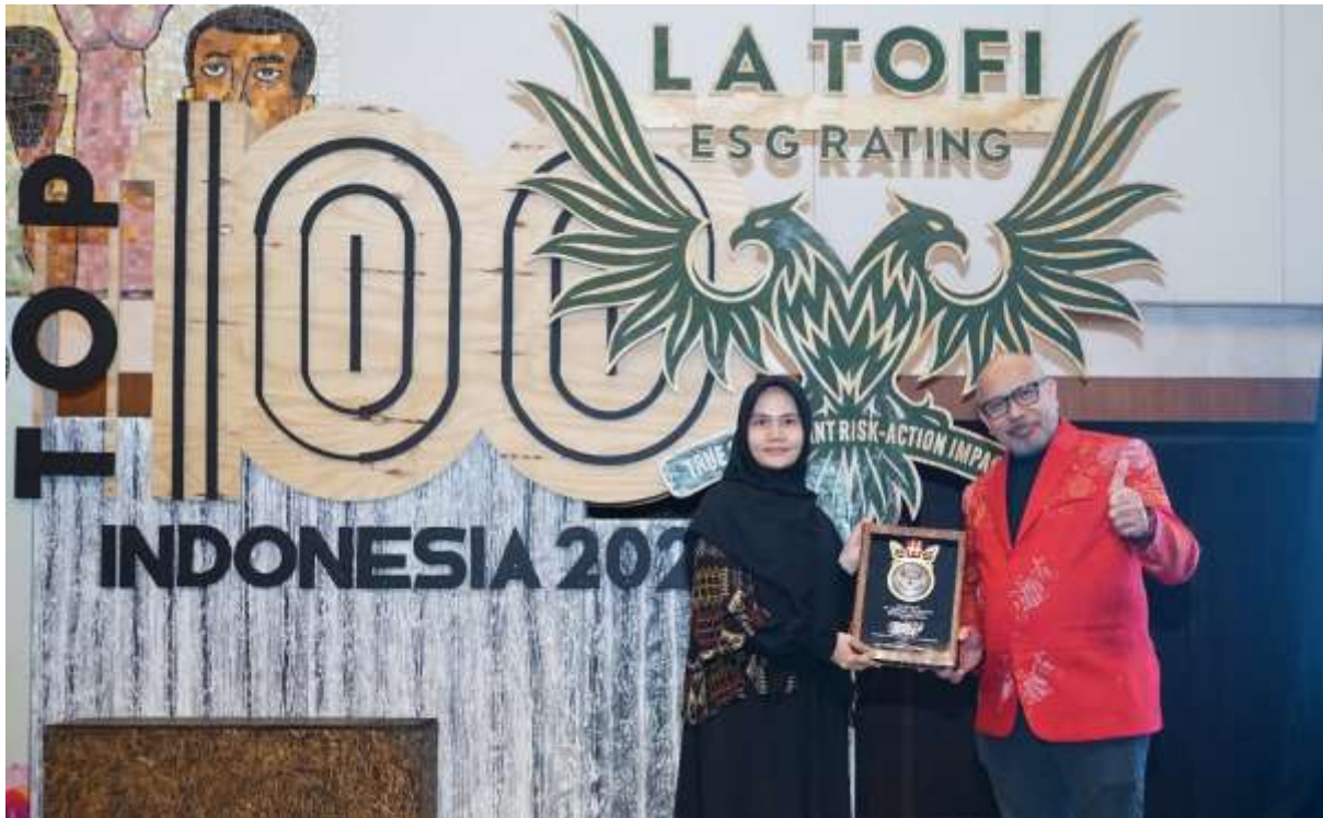
PT Pertamina Retail