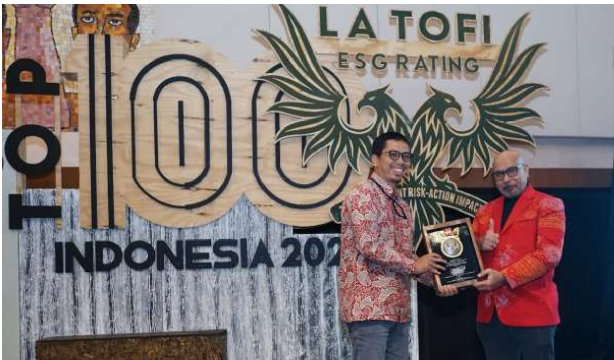
PT Pertamina Gas