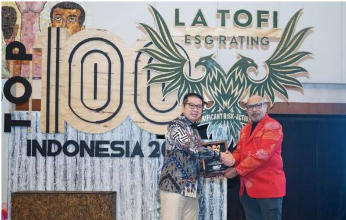
PT Krakatau Steel