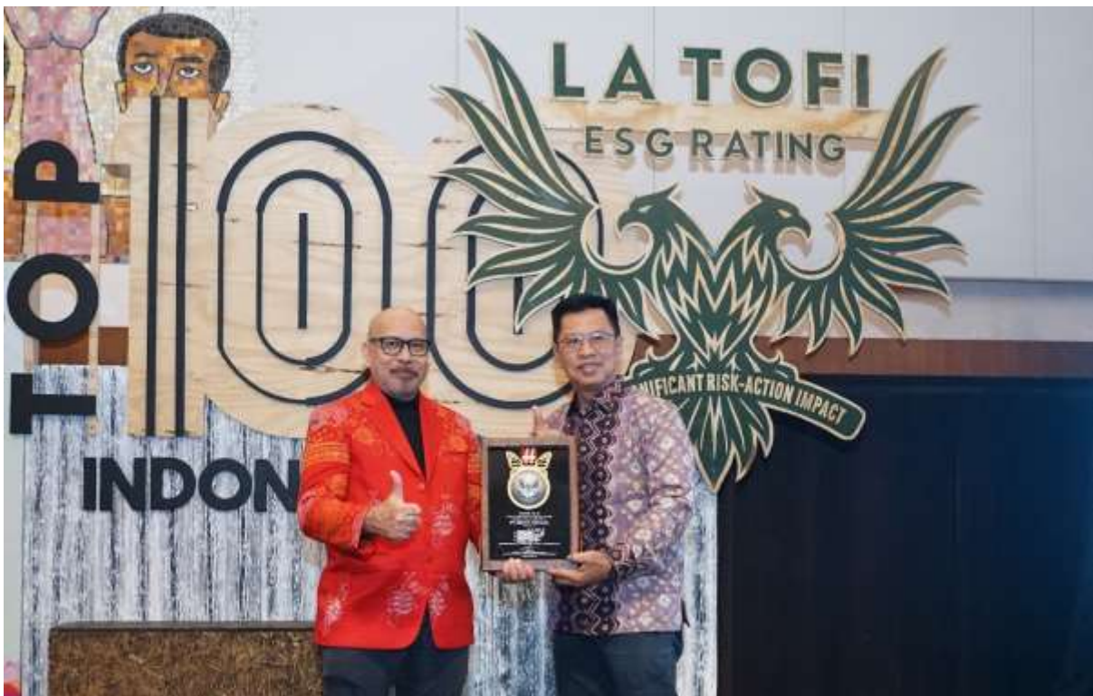
PT Semen Tonasa