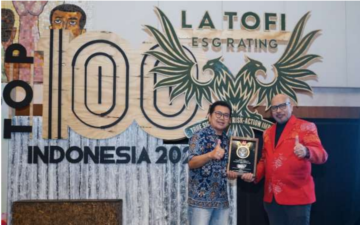
PT Astra Agro Lestari