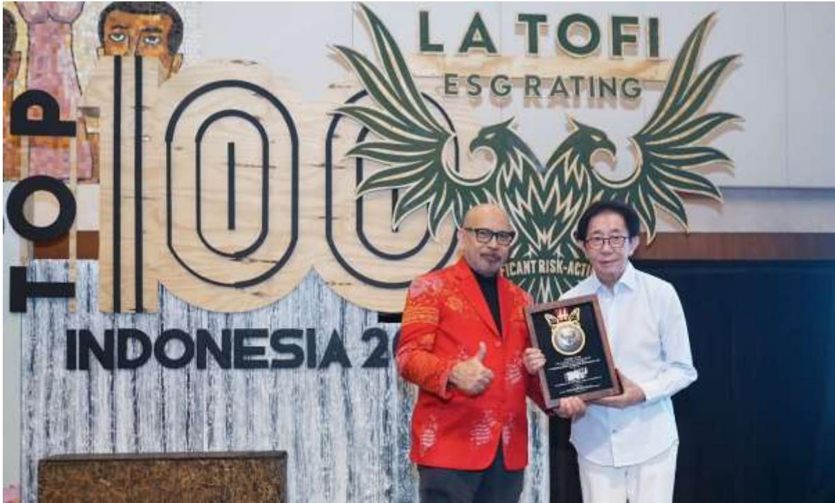
PT Industri Jamu dan Farmasi Sido Muncul Tbk