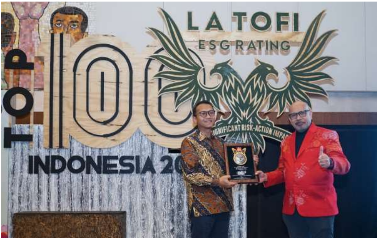
PT Petrosea Tbk