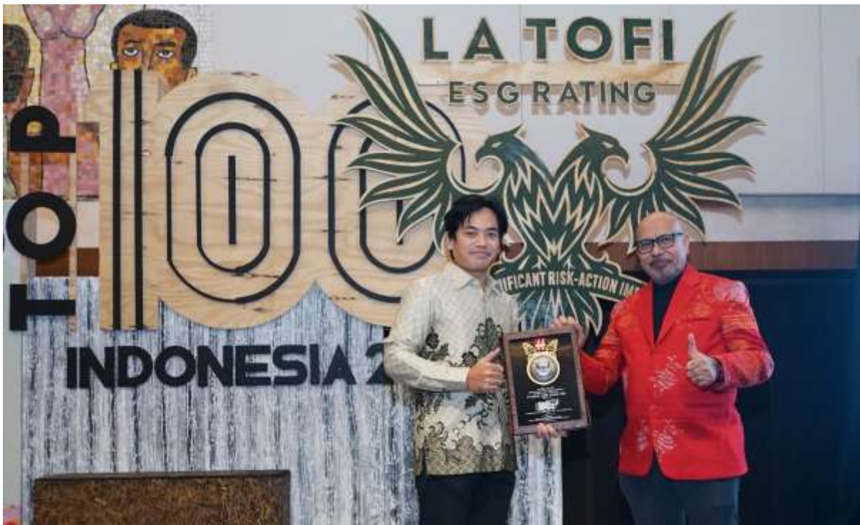
PT Bank CIMB Niaga