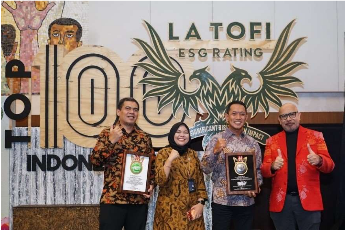
PT Surveyor Indonesia (Persero)