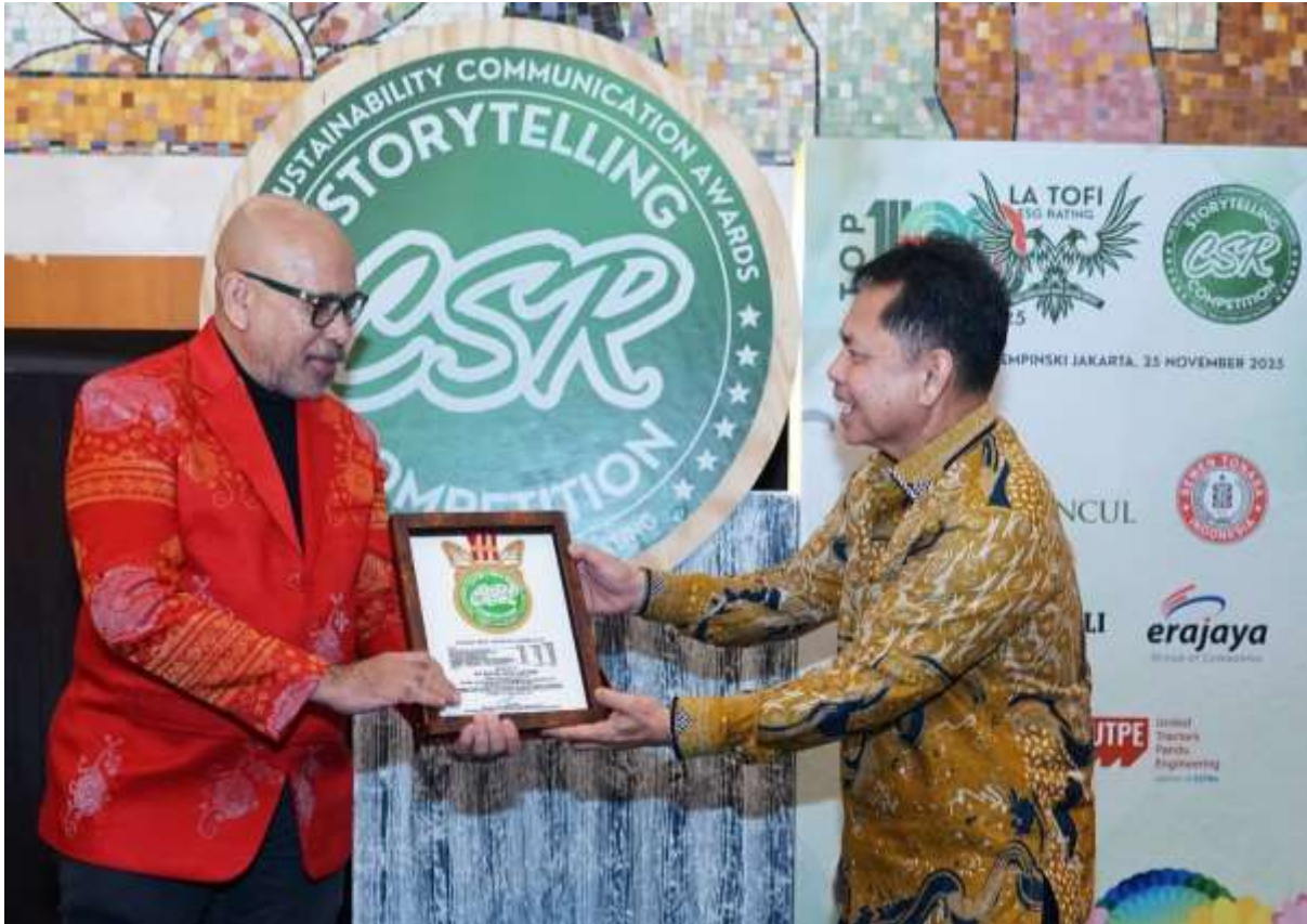
PT Riota Jaya Lestari